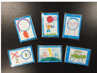
▲ イラストコンクール 優秀賞ティッシュ