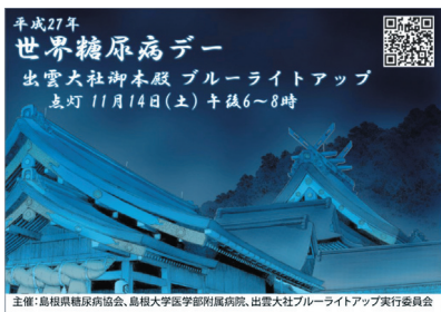
▲ オリジナルティッシュ