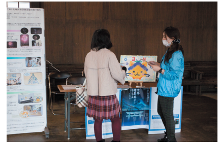
▲ インスリンアート