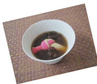
低カロリーゼンざい