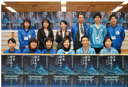
▲ 記念講演会スタッフ