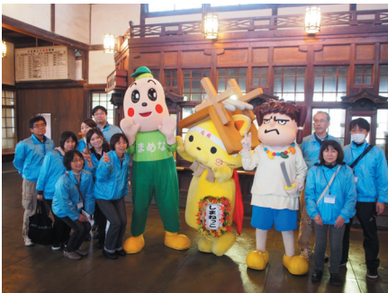
◀ 旧大社駅スタッフ