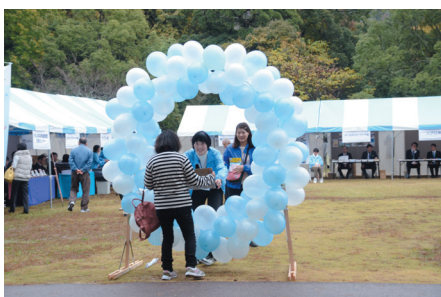
◀ シンボル バルン