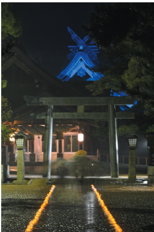
▲ 御本殿 参道から